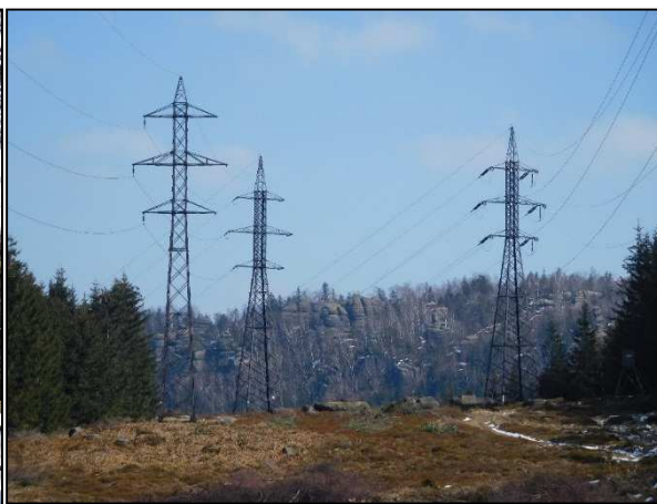
Vysoké vedení přes NPR Broumovské stěny