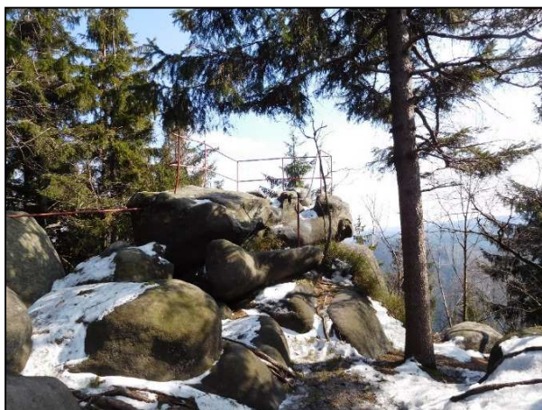
Vyhlídky Božanovský Špičák