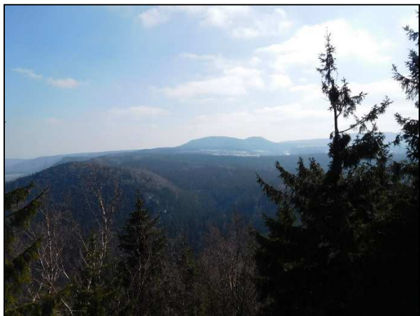
Pohled na Stolové hory z Božanovského Špičáku